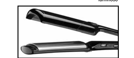
Placas extra largas de 38 mm de ancho 50 opciones de temperatura Botón de encendido/apagado con indicador luminoso Placas cóncava/convexa para dar cuerpo, crear ondas o rizos y doblar las puntas